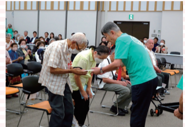
金婚夫婦お祝い品贈呈