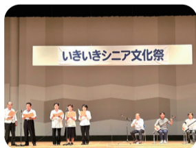
いきいきシニア文化祭