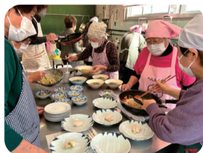
食と栄養のお話とクッキング教室