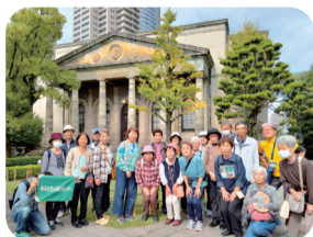
歩こう会(春・秋) 秋~秋の大川沿いに庭園と商店街~