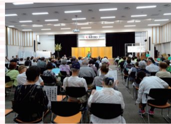
地域敬老会の開催