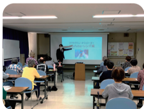
スマートフォン体験講座「GoogleレンズとGoogleマップ」