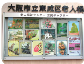
12月 ひがしなり絵画サークル

詳しい内容の問い合わせ・申し込みは東成区老人福祉センターまでご連絡ください。 P4へ