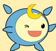
なかま かかわるくんと なかま きづくちゃん

ふれあい広場の開催に向け、地域組織や福祉関係団体が参画する実行委員会を設置し、会議を重ねていくことで、普段からのつながりができてきました。