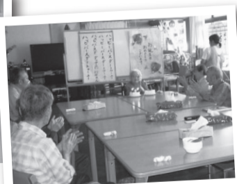
少規模デイなのでアットホームな雰囲気です。