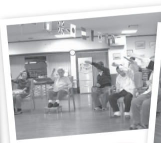
体操やゲームで心身ともにリフレッシュ! みなさん楽しく参加されています。