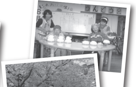
お花見・運動会・敬老祭り・クリスマス会など…季節の行事も盛りだくさんです。

お昼はテーブルを囲んで、皆さんと一緒に和やかに食事をされています。また、ご自宅までの送迎も柔軟に対応しています。