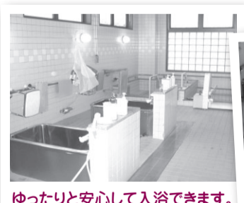
ゆったりと安心して入浴できます。