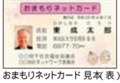
おまもりネットカード 見本(表)