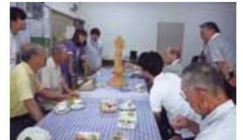
男性限定的日を設けて参加しやすく(宝栄)