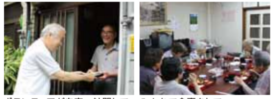
ボランティアが自宅へ訪問して利用者へ手渡す配食活動 みんなで食事をして楽しくしゃべりする会場活動

東成区内10校下の社会福祉協議会で高齢者食事サービス事業が実施されています。一人暮らしの高齢者や高齢者のみの世帯の方を対象とし、住み慣れた地域で孤立することなく、地域住民と交流をもちながら地域での生活を健康的に継続していけるように取り組まれています。この活動は、利用者からの利用料と、委託料をもとに実施されています。