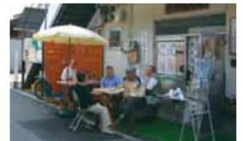
テラス風で立ち寄りやすく(今里)

区内11校下、15会場でボランティアさんが中心となり、住民が互いにふれあえる場をつくる目的で実施されています。地域に所在する介護保険施設を利用する方が参加されていたり、障がい者施設の手作りおやつなどをコーヒー・紅茶等と共に提供するなど、地域と施設とのつながりづくりにもなっています。もちろん、ふれあいを目的としてなら、どなたでも参加していただけます。