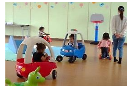
乗り物やバスケットゴールなど新しいおもちゃもふえたよ♪