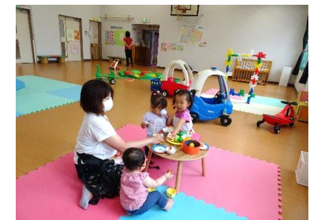
美味しいごはんができたかな？